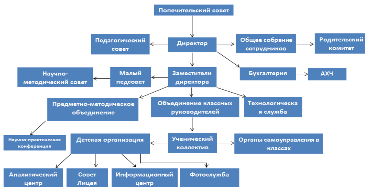
Рисунок 1 – Структура системы управления ЧОУ «Лицей ТГУ»

Органами управления Лицея ТГУ являются директор, зам. директора, объединение классных руководителей и ученический коллектив. Структуру, компетенцию органов управления Лицея, порядок их формирования, сроки полномочия и порядок деятельности определяет Устав Лицея.